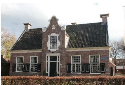
Foto De Pleats, één der oudste boerderijen.

Maar eerst nog: op het nieuwe Van Sminiaplein in Burgum ziet u kunstwerk De Blauwe Hond, verderop de gemoderniseerde versie van het eeuwenoude café 't Roodhert.