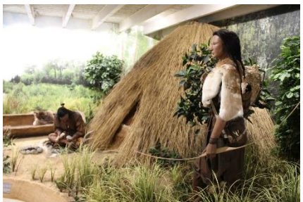
archeologische locatie Jagerskamp

Weer verder vanaf 75 het zandpad de Achterweg op naar Eastermar, met haar fraaie brink en het nostalgisch vaartje met wilgen. Fiets het dorp door naar 79 en daarna naar de brug, gevolgd door 82 . U volgt nu een pad langs genoemde De Leijen naar 82 en 83 en dan naar 47 Sumar.