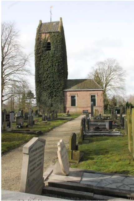
Foto toren en kerkje 't Heechsân

Om bij museumpark De Spitkeet te komen volgt u de route naar 16 . Na een eventueel bezoek aldaar, om kennis te nemen van het eerdere “earme heidefolk”, bent u al bij 16 . Een oud zandpad de Mûntsegrope (monniken greppel, waarschijnlijk een grens/gebied aanduiding). Ook hier weer via prachtige kenmerkende “de wâlden” fietspaden via 77 en 76 naar 75 : ‘t Heechsân o/d Eastermar.