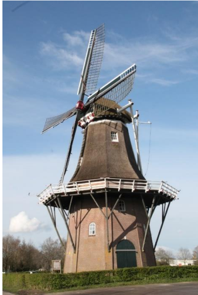
Foto Korenmolen De Hoop

Na 47 richting 84 , hier nadert u het prachtige v.m. dorpskroegje van Sumar: De Koekoek.