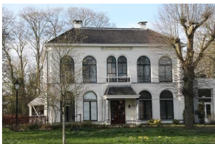
Foto Glinstra State

De Schoolstraat kent nog een paar historische panden als De Pleats, restaurant en cultureel centrum, daartegenover de v.m. hoofdonderwijzerswoning van Den school met den Bijbel, ernaast Villa De Beuk en verderop de v.m. Nutskleuterschool, nu muziekschool en als laatste landgoed Glinstra State, nu zalencentrum.