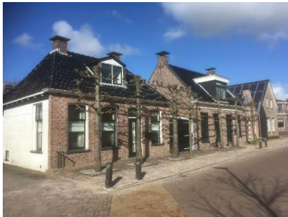
Foto Nijstêd, afslag It Syl.

Aan het eind van de Kloosterlaan gaat u linksaf langs de fraaie Kruiskerk (12 e eeuw), neem even de tijd, en verder op de Nieuwstad met als route punt 66 .